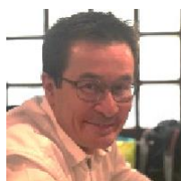
Xavier SPANEUT BPCE SA