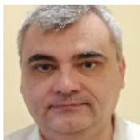
Aldea CATALIN BPCE SI